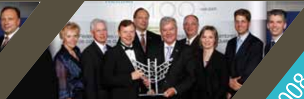
Grande entreprise - Artopex inc. (Estrie)