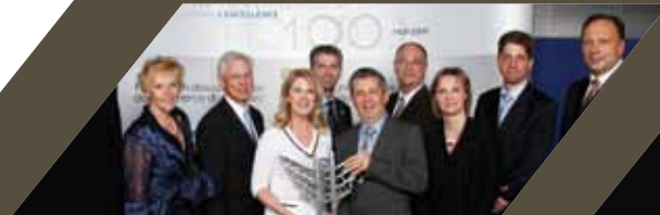
PME - Bleu Lavande inc. (Estrie)