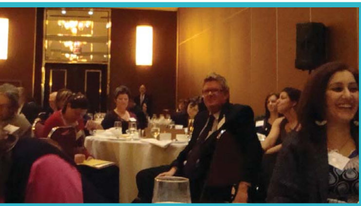
Session de formation à Québec, atelier sur la cohabitation intergénérationnelle.

La loi sur le lobbyisme, les programmes de partenariat de la FCCQ, la cohabitation intergénérationnelle et les nouveaux médias ont notamment été abordés. Une conférence du professeur Pierre Fortin sur l'état de l'économie québécoise a aussi été prononcée.