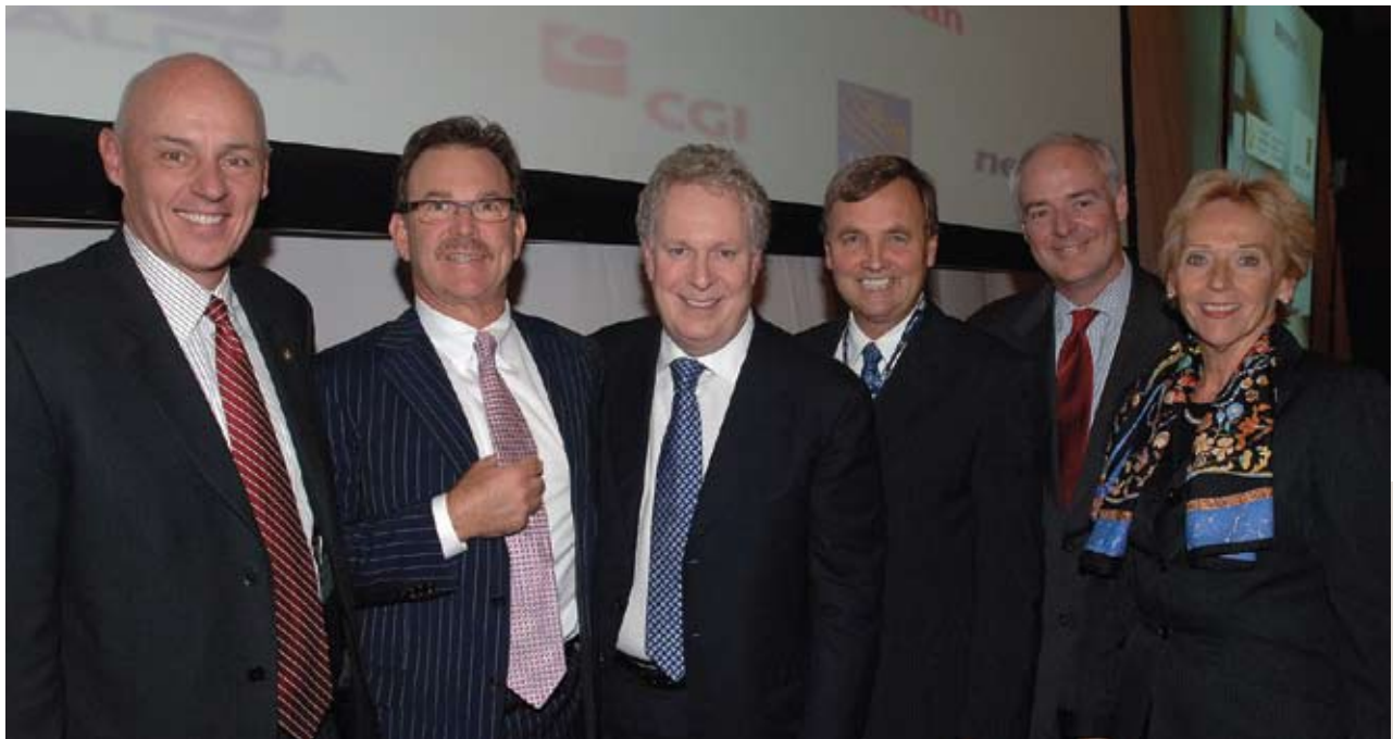
Congrès conjoint FCCQ-CCC Québec, octobre 2008

Du 3 au 6 octobre 2008, la FCCQ a tenu son congrès annuel dans la Capitale nationale, conjointement avec la Chambre de commerce du Canada. Cela, afin de souligner le 400 e anniversaire de la ville de Québec et le 200 e de la Chambre de commerce de Québec. Plus de 600 délégués étaient présents, dont 350 du Québec. Lors de l'Assemblée générale de la FCCQ, tenue en marge du congrès, les participants ont adopté deux résolutions, l'une touchant les travailleurs autonomes et l'autre, l'environnement.