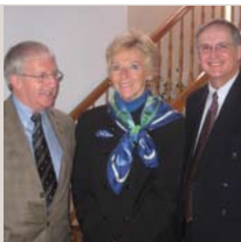
Tournée à Saint-Hyacinthe et à Sherbrooke