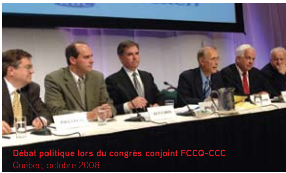
Débat politique lors du congrès conjoint FCCQ-CCC Québec, octobre 2008